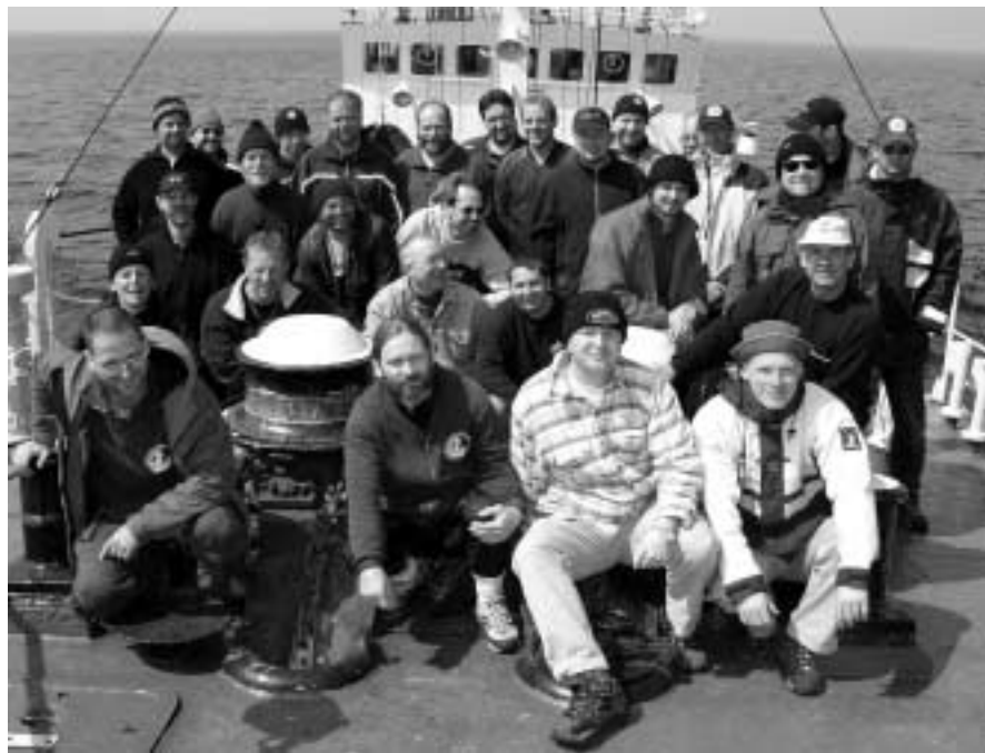
Tauchercrew und Besatzung auf der MS ARTUR BECKER

Weitere Forschungen und Untersuchungen werden in der nächsten Zeit durch Unterwasserdenkmalpfleger folgen, denn hier gilt es, ein erhaltenswertes technisches Unterwasserdenkmal für Interessierte zu bewahren. Die Mission UNDINE war ein voller Erfolg für alle Beteiligten. Diese Art von Forschungsfahrten mit dem Gespür für das Außergewöhnliche sollten unbedingt im Jahr 2004 unter Federführung unserer Marinekameradschaft weitergeführt werden. Das Landesamt für Bodendenkmalpflege MV, Abt. Unterwasserarchologie, hat seinerseits großes Interesse an einer Zusammenarbeit mit uns signalisiert. Vielleicht gibt es ja noch den einen oder anderen Kameraden aus unseren Reihen, der im nächsten Jahr mit uns auf eine Expeditionsreise der besonderen Art gehen möchte. Von einem neuen Projekt wird Ende diesen Jahres zu hören sein.